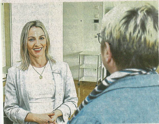
gesundheitsmanagement und Familienfreundlichkeit wir